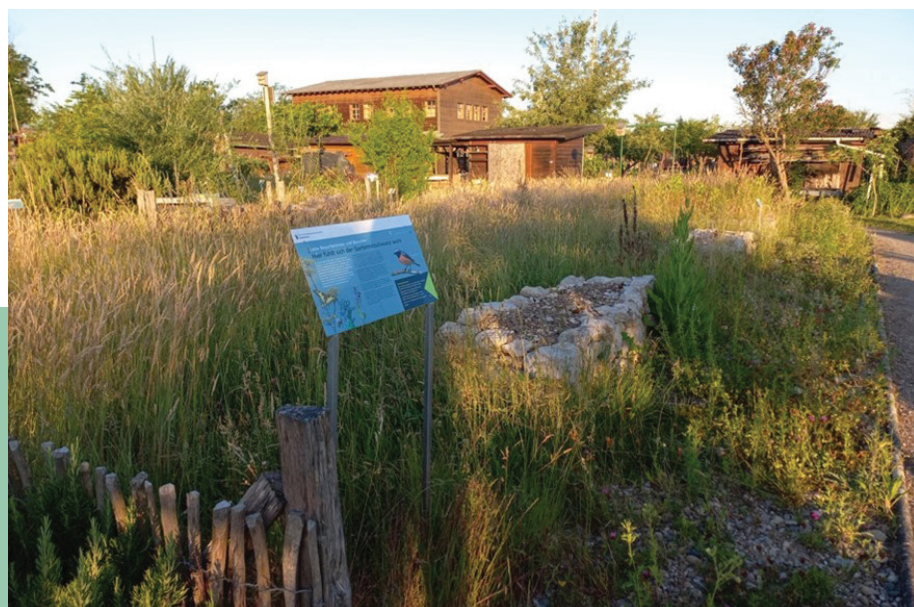
Fig. 3: Parcelle pour les rougequeue à front blanc dans un jardin familial. Un nid y a été observé lors des cartographies effectuées dans le cadre du suivi des mesures

mesure à appliquer consiste à aménager des surfaces riches en insectes telles que des prairies fleuries, des bandes herbeuses et des tas de branches. Par ailleurs, il faudrait renoncer encore plus aux pesticides. Dans le canton de Bâle, les jardins familiaux doivent en principe être cultivés sans pesticides depuis la moitié des années 1990 déjà.