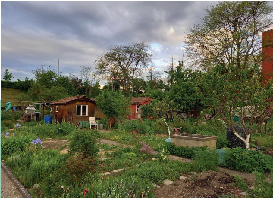
Fig. 2: Jardins familiaux typiques dans la zone «Friedmatt» avec un territoire de rougequeue à front blanc en 2021.

suivants sont déterminants: cavités de nidification adaptées, offre élevée (biomasse) de proies (insectes et araignées), accessibilité des proies et présence d'arbres structurant l'habitat.