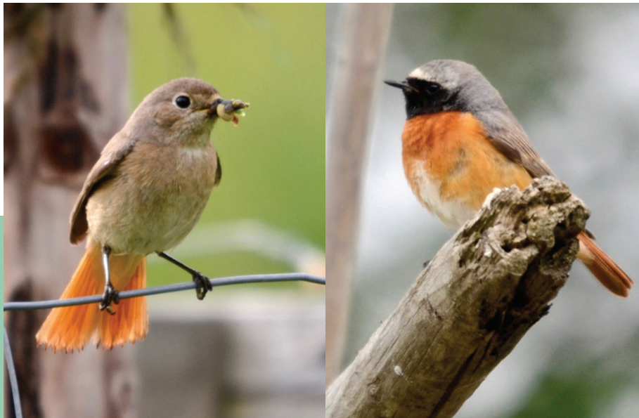
Fig. 1: Rougequeue à front blanc femelle (gauche) et mâle (droite).