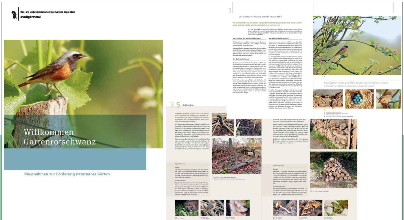
Fig. 4: Extraits de la brochure sur le rougequeue à front blanc éditée par le canton de Bâle-Ville en 2019.

série Mission B consacré à la biodiversité dans les jardins bâlois a été diffusé en 2018 sur la SRF. Il y est notamment question des revalorisations découlant du plan d'action en faveur du rougequeue à front blanc ( https://www.srf.ch/sendungen/schweiz-aktuell/wildes-basel ).