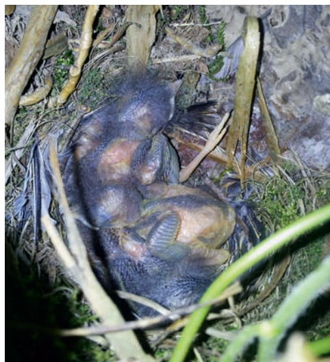
Abb. 3. Drei Gartenrotschwanz-Junge aus der Zweitbrut des ♀ von Abb. 1 (Nr. 12 in Tab. 3). Das Nest wurde frei im dichten Efeubewuchs erstellt. Aufnahme 1. Juni 2013, S. Zingg. – Three Common Redstart young of the second brood from the female in fig. 1 (no. 12 in Table 3). This nest was directly constructed in dense ivy vegetation.

Für die Region Nordwestschweiz führen die beiden unterschiedlichen Erfassungsmethoden für die Häufigkeit von Zweitbruten zu sehr ähnlichen Ergebnissen. Sie belegen erstmals ei-