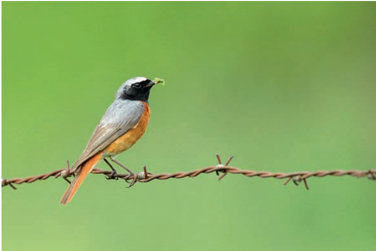
Abb. 4. Gartenrotschwanz-♂. Aufnahme Mai 2014, F. Leugger. – Common Redstart male.

nen hohen Anteil von Zweitbruten auch in der Schweiz und stützen somit die Annahme, dass solche beim Gartenrotschwanz in Mitteleuropa regelmässig vorkommen, in den fennoskandi-