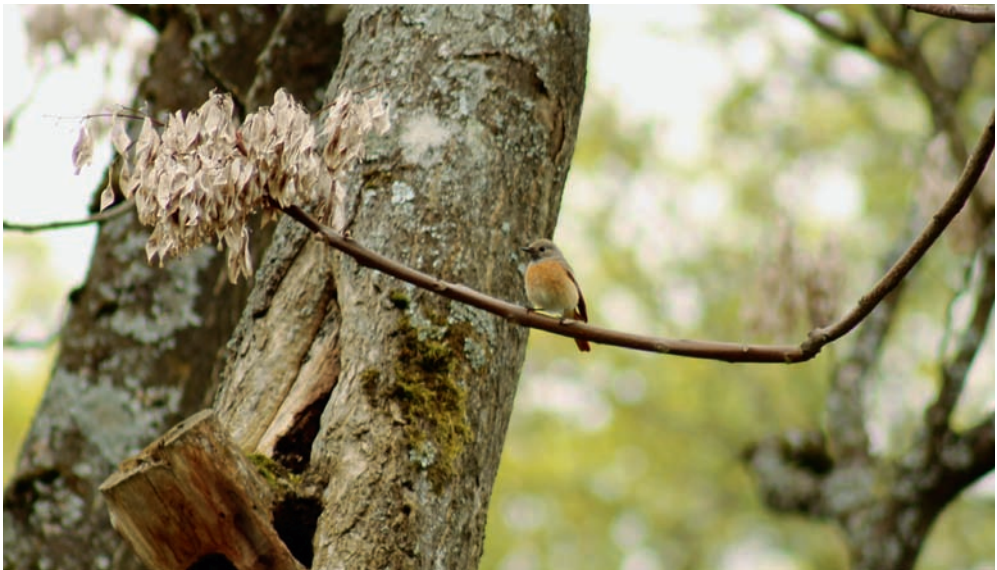
Abb. 1. Dank verschiedenen Gefiedermerkmalen individuell erkennbares Gartenrotschwanz-♀ vor der Nisthöhle für die Erstbrut (Nr. 12 in Tab. 3). Aufnahme 26. April 2013, S. Zingg. – A female Common Redstart in front of the cavity used for the first brood (no. 12 in Table 3). Due to the characteristic colouration of this female it was possible to individually identify it.

Frühester Legetermin war der 17. April (2 Bruten, beide 2011). Bei 66 % aller 50 ausgewerteten Bruten erfolgte der Legebeginn vor dem 6. Mai. Für die danach folgenden Pentaden liegen deutlich weniger Bruten vor. Zehn Bruten (20 %) wurden erst nach dem 25. Mai begonnen. Wenn unsere Annahme zutrifft, dass es sich bei Bruten mit Legebeginn nach dem