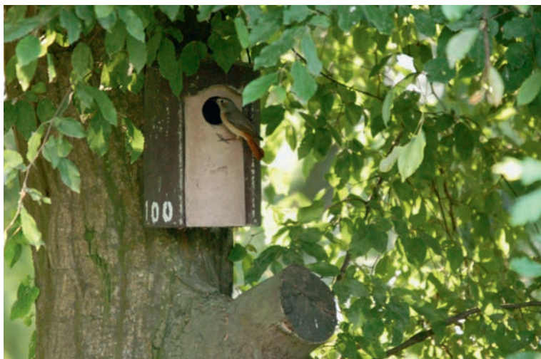
Abb. 5. Gartenrotschwanz-♀ vor einem Nistkasten mit einer Erstbrut. Nach dem Ausfliegen der Jungen folgte im selben Nistkasten eine Zweitbrut (Nr. 2 gemäss Tab. 3). Aufnahme 19. Mai 2011, N. Martinez. – Common Redstart female in front of a nest box with a first brood. After fledging of the young, the same nest box was reused for a second brood (no. 2 in Table 3).

(1982) noch Veistola et al. (1996) eine Zweitbrut. Weiterhin offen bleibt, ob Gartenrotschwänze in höheren Lagen Mitteleuropas, beispielsweise in den Alpen und im Jura, ebenfalls strikt nur eine Jahresbrut durchführen.